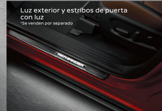
Luz exterior y estribos de puerta con luz *Se venden por separado

Imágenes de referencia. Los accesorios mostrados pueden venderse por separado. Consulta especificaciones, versiones y equipamientos disponibles para México en Nissan.com.mx/accesorios. *Los Accesorios Afiliados son aquellos cuya garantía es otorgada directamente por el fabricante del accesorio y no por Nissan Mexicana, S.A. de C.V. Consulta el listado de Accesorios Afiliados, así como términos y condiciones en Nissan.com.mx/Accesorios