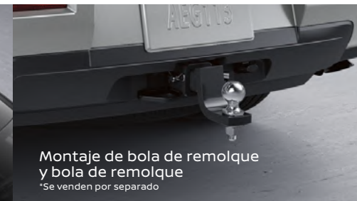
Montaje de bola de remolque y bola de remolque *Se venden por separado