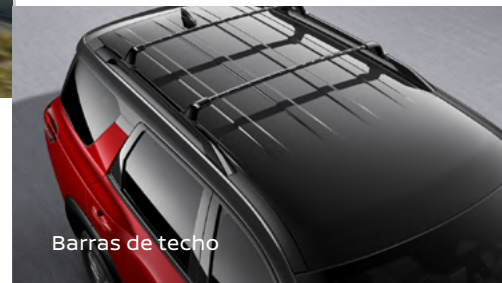
Barras de techo